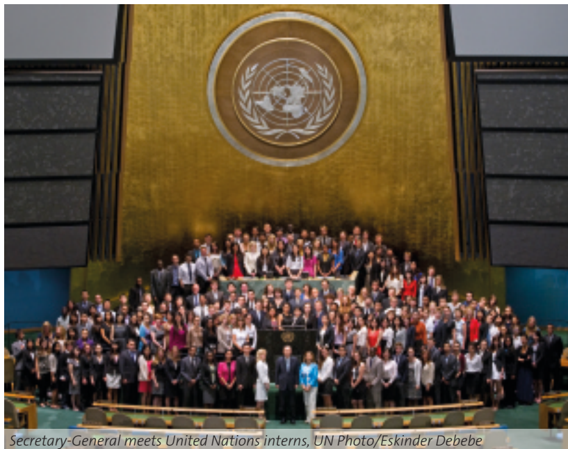
Secretary-General meets United Nations interns