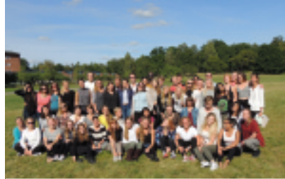
Inspark för kandidatstudenterna