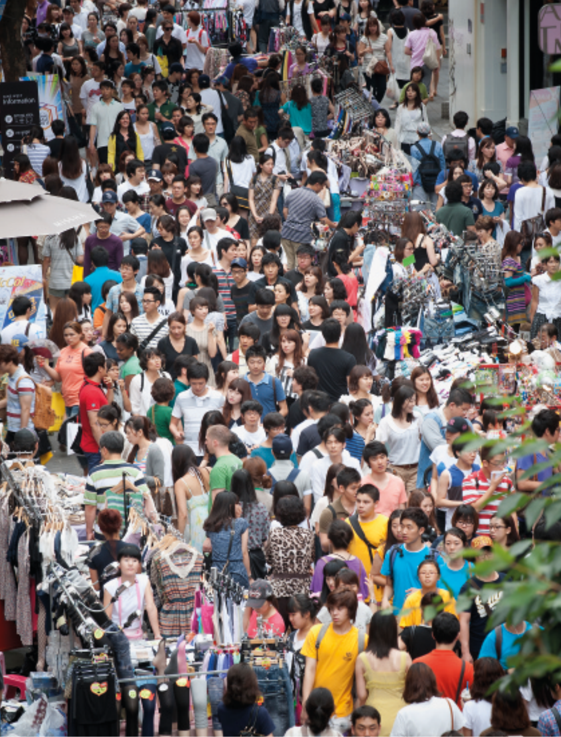
In 2011, the world population passed the 7 billion mark. That year's annual report by UNFPA, the UN population fund, highlights the trends behind the numbers: roughly one in two people now lives in an urban area, the global average life span is 68 years, and close to a billion people are 60 and over. Seoul, Republic of Korea